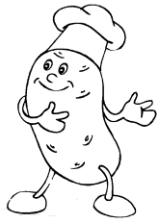
potomme de terre